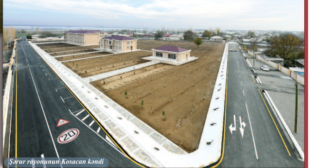
Şərur rayonunun Kosacan kəndi