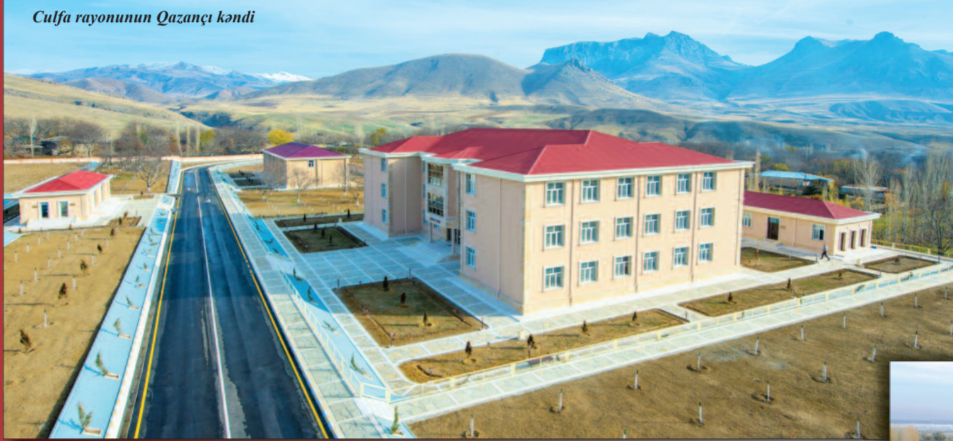
Culfa rayonunun Qazançı kəndi