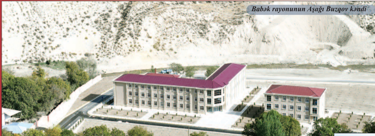
Babək rayonunun Aşağı Buzqov kəndi