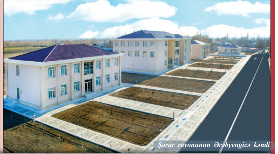
Şərur rayonunun Ərəbyengicə kəndi