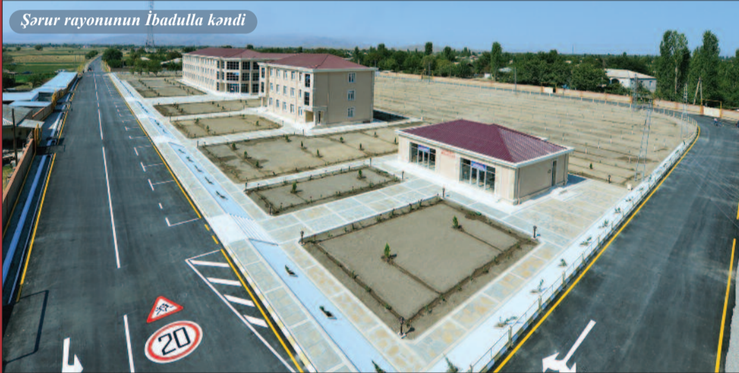
Şərur rayonunun İbadulla kəndi